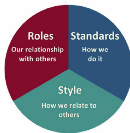
Personal Brand Dimensions